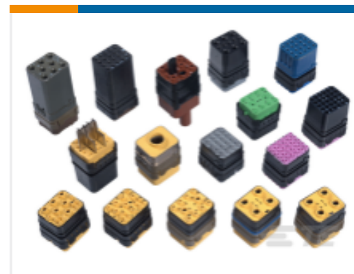
TE 产品编号ZPF000000000202095 DMC-M 0804 AW 01