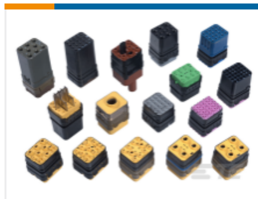
TE 产品编号ZPF000000000202094 DMC-M 0402 AW 01