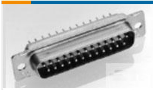
TE 产品编号207252-2 PLUG ASSY, SZ 1, AMPLIMITE