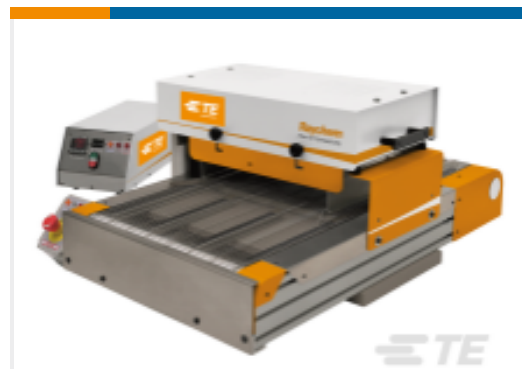
TE 产品编号 2326489-1 MODEL 105 TUNNEL OVEN, 36" ENTRY, STANDA