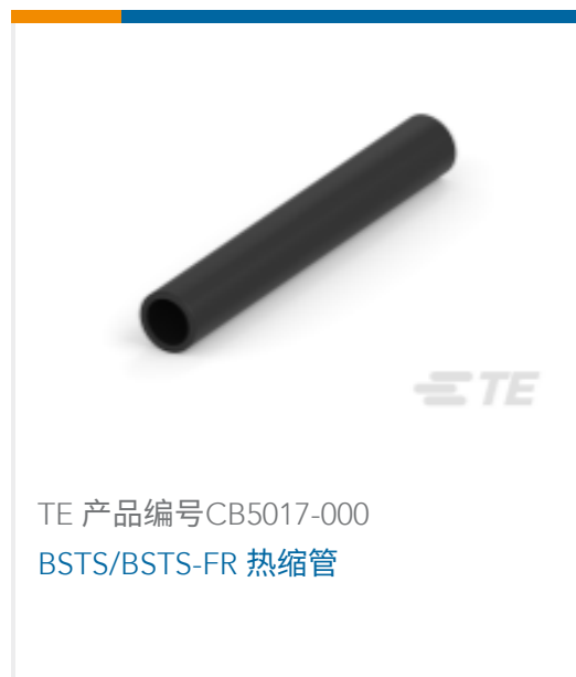
TE 产品编号CB5017-000 BSTS/BSTS-FR 热缩管