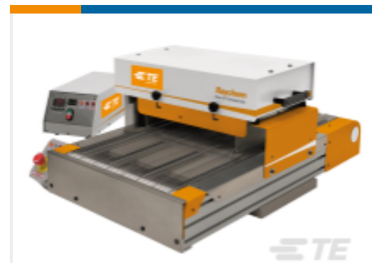
TE 产品编号 2394980-1 MOD 105 TUN OVEN, 69" ENTRY, STANDARD