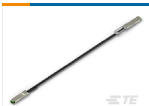
TE 产品编号2333393-7 QSFP 25GIG 30AWG 3 METER