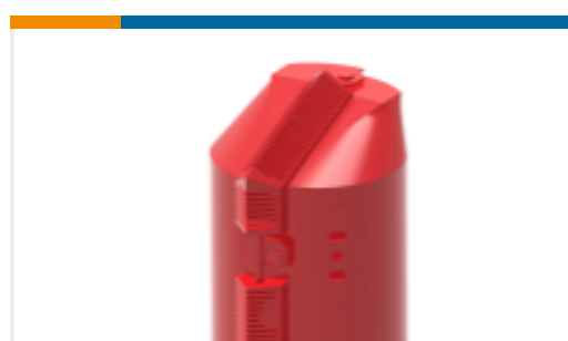
TE 产品编号A70988-000 衬套保护罩