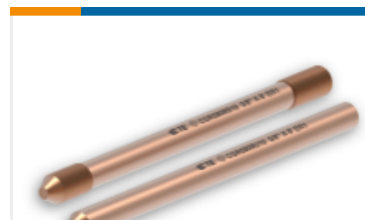
TE 产品编号EN3751-182 CGR5808U10