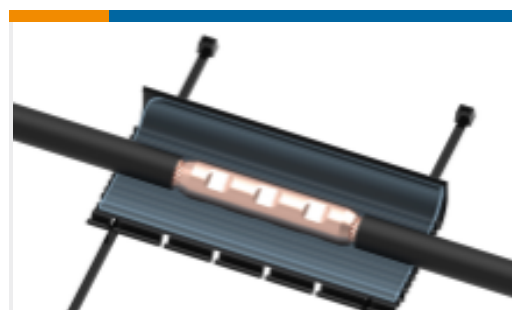
TE 产品编号128958-000 GELWRAP-50/20-300(B12)