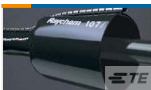
TE 产品编号337100-000 CRSM-107/29-1200