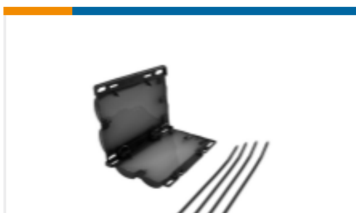
TE 产品编号1710501-1 GELPACT-SMY