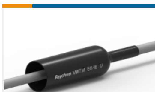
TE 产品编号405531-000 中厚壁热缩管