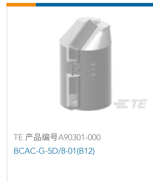
TE 产品编号A90301-000 BCAC-G-5D/8-01(B12)