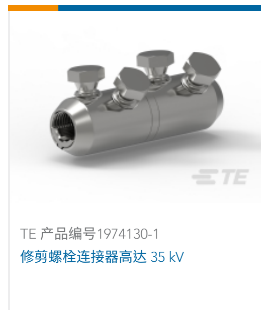
TE 产品编号1974130-1 修剪螺栓连接器高达 35 kV