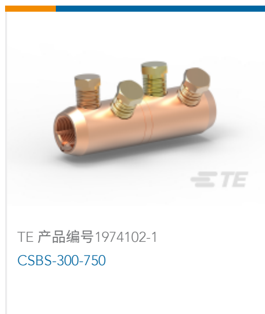
TE 产品编号1974102-1 CSBS-300-750