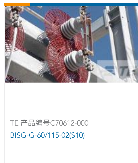
TE 产品编号C70612-000 BISG-G-60/115-02(S10)