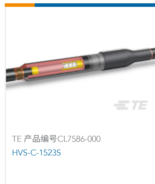
TE 产品编号CL7586-000 HVS-C-1523S