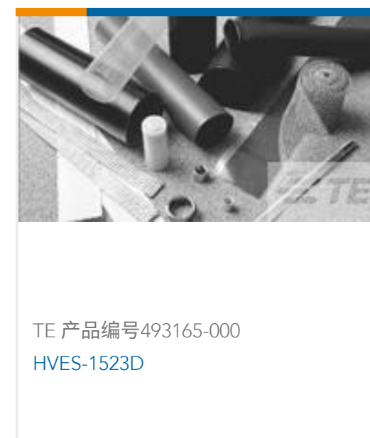
TE 产品编号493165-000 HVES-1523D