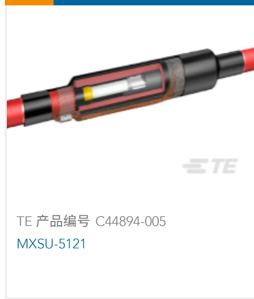
TE 产品编号 C44894-005 MXSU-5121