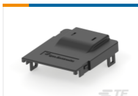
TE 产品编号1986186-1 Strain Relief,20 Posn,D3000 Dynamic, 2