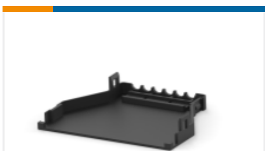
TE 产品编号1776695-1 Strain Relief, D5200, Dynamic AU,TB