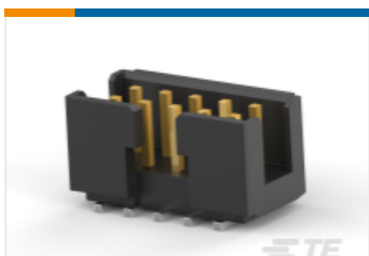
TE 产品编号1-2373376-0 10P,2MM,SHRD HDR,DRV,T,SMD,0.1 AU,TB