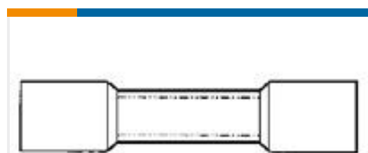
TE 产品编号55845-1 #8 PRE-INSUL SEALED SPLICE