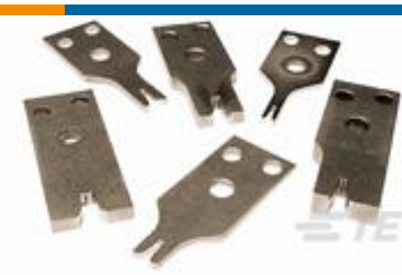
TE 产品编号5-1633664-0 CRIMPER, WIRE F .045