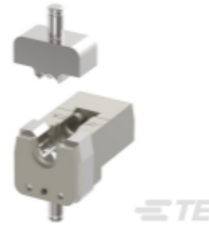
TE 产品编号2326507-1 DIE SET PCON 12-4P F 12MM2