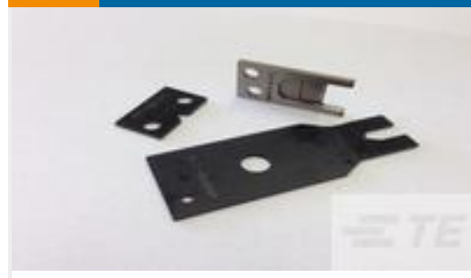
TE 产品编号1803088-1 BLADE, SLUG