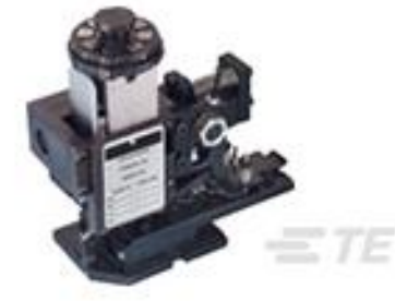
TE 产品编号1852123-1 HDM EMPO055F090F LM & G