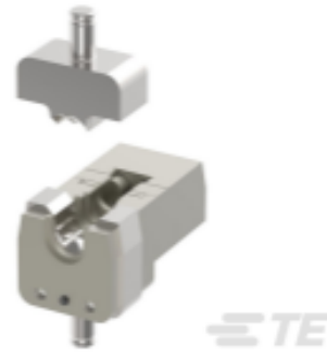
TE 产品编号2326506-1 DIE SET PCON 12-4P F 5MM2