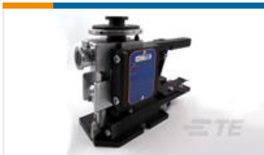
TE 产品编号2150288-1 OCEAN_2.0_Applicator-E-045F090F