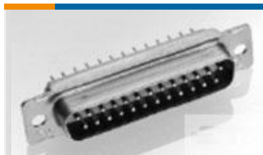
TE 产品编号211529-1 AMPLIMITE,ASY,RCPT,FB,109,5