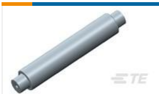
TE 产品编号592586-2 TERM JCT,SINGLE SPLICE,SZ 20