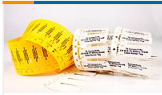
TE 产品编号E99238-000 HTCM-SCE-TP-1/2-4H-9