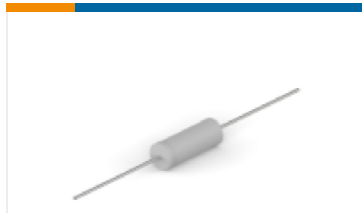
TE 产品编号2-2176412-3 5W XSM M/OX 5% 43R