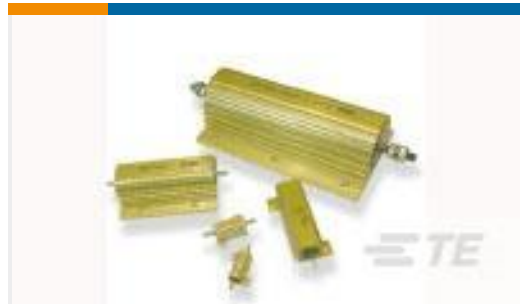
TE 产品编号3-1625985-4 NNSA50 25R 5%