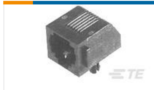
TE 产品编号5555165-1 M/J, LPF, R/A, 6P/6C, TIN, BUL