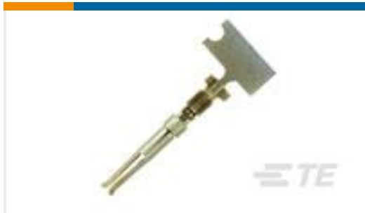
TE 产品编号1658537-2 SOCKET CONT DUPL PLT LP HD-20