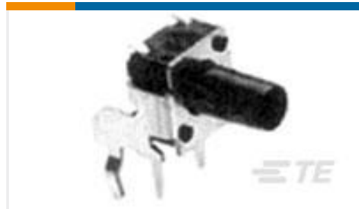
TE 产品编号2-1825027-0 FSMRA7JH04=R/A, TACT PB SW, 160G