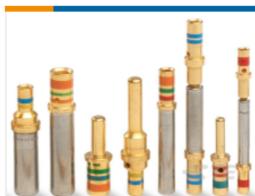
TE 产品编号6162-347-1231 CONT SOC ASSY