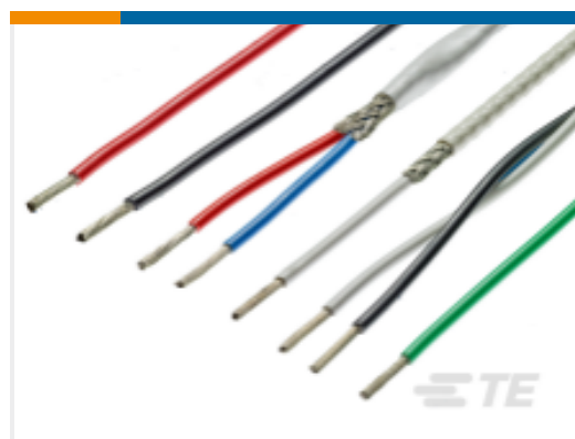
TE 产品编号 2611473001 44A0111-12-54