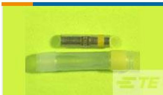
TE 产品编号 650076-000 D-436-38