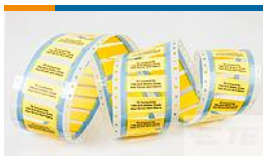
TE 产品编号 404545-000 TMS-SCE-1K-3/4-2.0-6