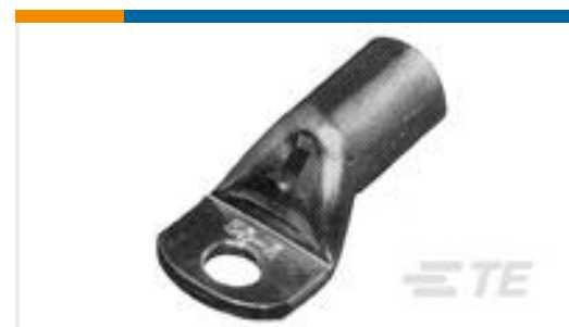
TE 产品编号 710031-2 XCT 10-5