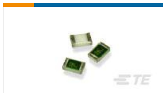
TE 产品编号 6-1879208-0 CPF 0402 3K0 0.1% 25PPM 1K RL