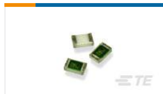
TE 产品编号 9-1879214-2 CPF 0402 3K32 0.1% 25PPM 1K RL