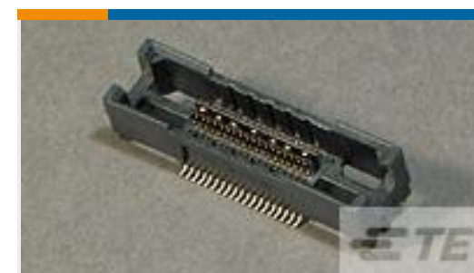
TE 产品编号 5767061-1 MICT, RECPT, 038, ASSY, 093, PDNI