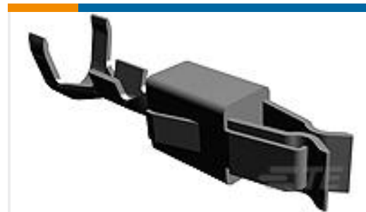
TE 产品编号964273-2 JPT A REC 2.8 Contact SWS Sn POS