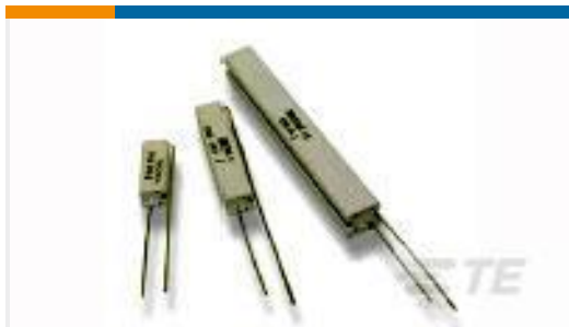
TE 产品编号4-1623732-0 BCHE 7 W 4K7 5%