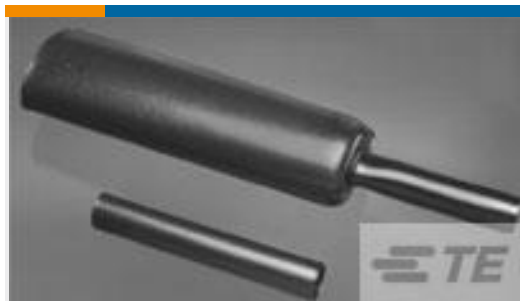
TE 产品编号E52178-000 RMW-85/25-1200/ADH-0