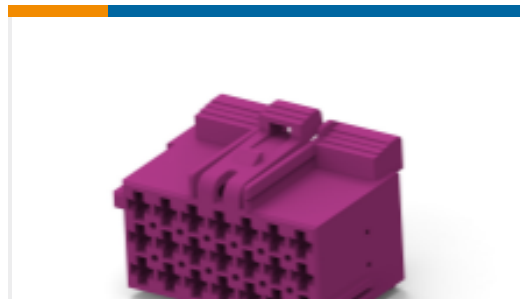
TE 产品编号1-967625-3 JUN-POW-TIM GEH 21P