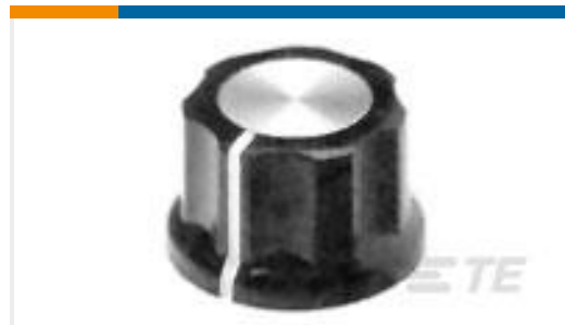
TE 产品编号4-1437624-6 PKES120B1/4=KNOB PLSTC FLUTED