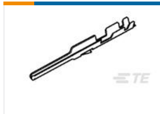
TE 产品编号 102107-1 MOD IV PIN LP