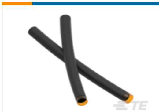
TE 产品编号 CX7198-000 RHW 热缩管