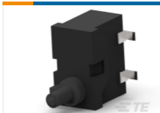
TE 产品编号 2331400-2 DET SW6.5X3.9X6.0 GW VERT. NO AG RL