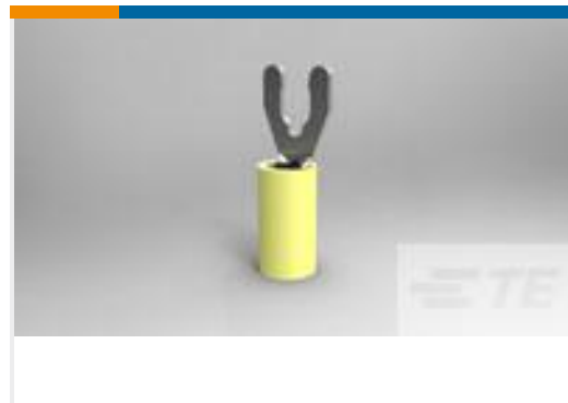
TE 产品编号 52943-1 TERMINAL,PIDG SPR SPD 12-10 10