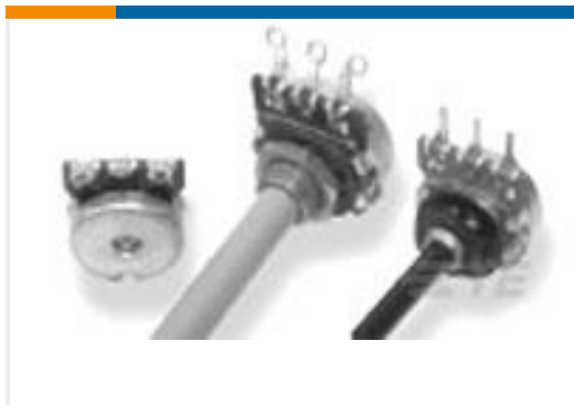
TE 产品编号 1624180-1 27E DUAL 5KA 6.35X50FL B7