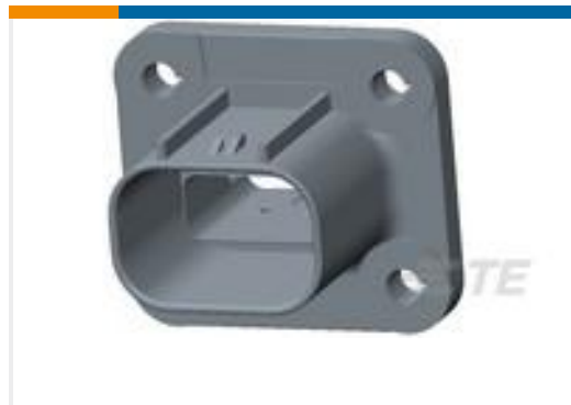
TE 产品编号 2103247-1 SPLIT HEADER ASSY, KEY A, HVA280