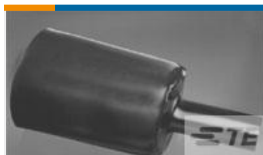
TE 产品编号CX7198-000 RHW-16/4-1200/ADH-0