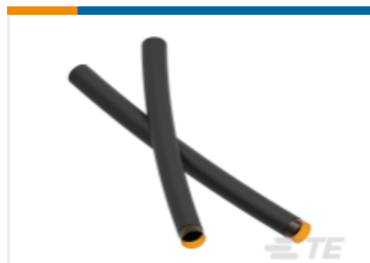
TE 产品编号F46631-000 RMW 热缩管