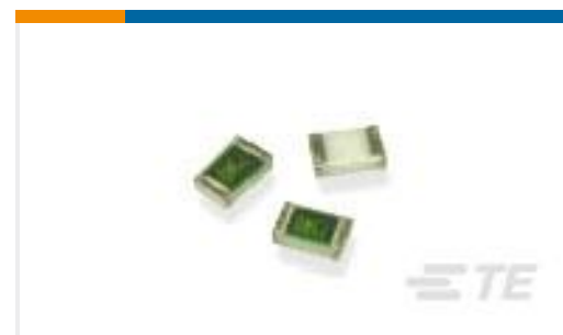
TE 产品编号1676221-2 RN 0805 1K0 0.1% 10PPM 1KRL