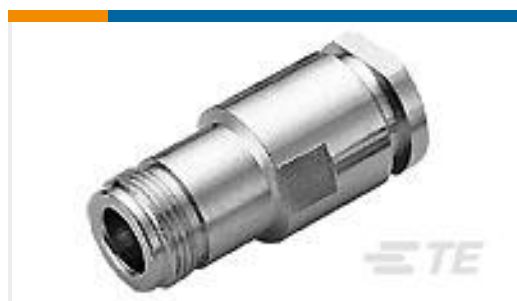
TE 产品编号1-1337406-0 N Str Jk PS 50Ohm Silver Pltd PSF 1 /4M,