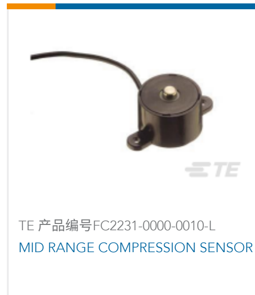
TE 产品编号FC2231-0000-0010-L MID RANGE COMPRESSION SENSOR