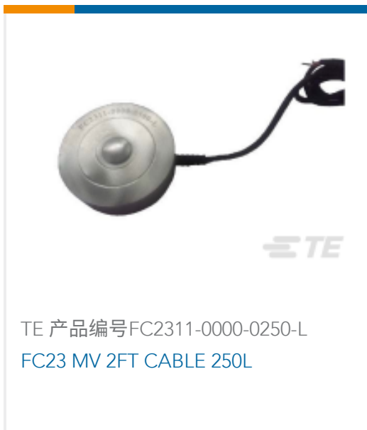
TE 产品编号FC2311-0000-0250-L FC23 MV 2FT CABLE 250L