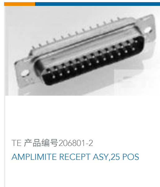
TE 产品编号206801-2 AMPLIMITE RECEPT ASY,25 POS