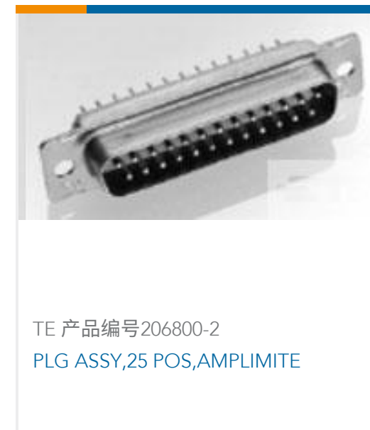
TE 产品编号206800-2 PLG ASSY,25 POS,AMPLIMITE