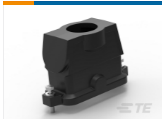
TE 产品编号T1922160140-000 H16BPR-TGHC-M40