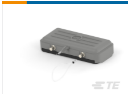
TE 产品编号T1010161600-000 H16B-KDTP-BO