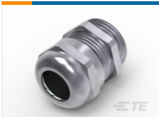
TE 产品编号T3609200102-000 DLX-20-M