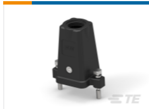
TE 产品编号T1926030116-009 H3APR-TGC-M16-EMC-C