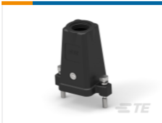
TE 产品编号T1926030116-009 H3APR-TGC-M16-EMC-C