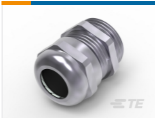
TE 产品编号T3609200102-000 DLX-20-M