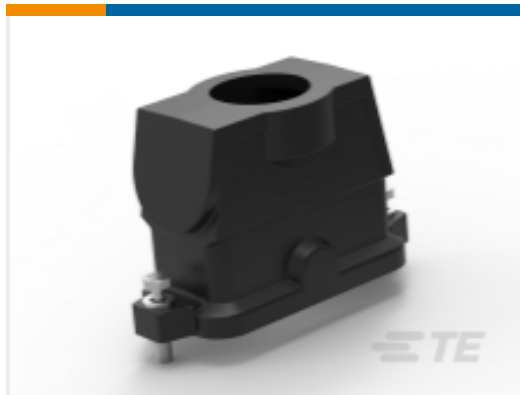
TE 产品编号T1922160140-000 H16BPR-TGHC-M40