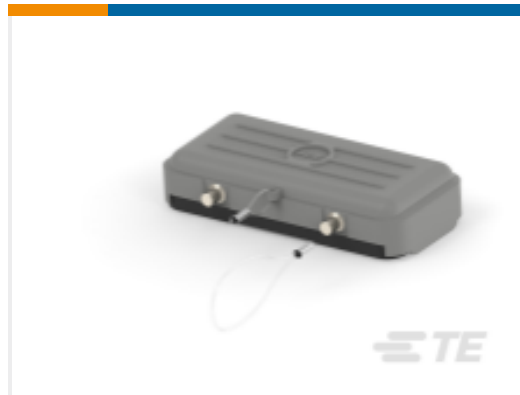
TE 产品编号T1010161600-000 H16B-KDTP-BO