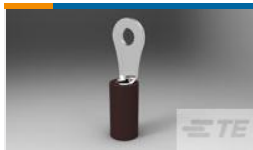
TE 产品编号1577620-1 TERMINAL RT PIDG PEEK STRATO 24-22 AWG