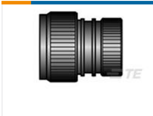
TE 产品编号527781-000 HEX40-AC-00-15-A5-1