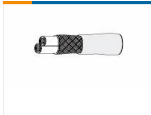
TE 产品编号272103-000 55A1123-20-9/96-9CS2275