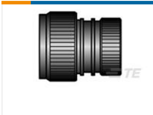
TE 产品编号527781-000 HEX40-AC-00-15-A5-1