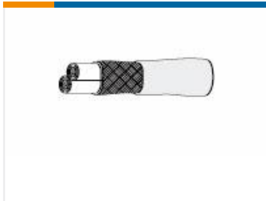
TE 产品编号272103-000 55A1123-20-9/96-9CS2275