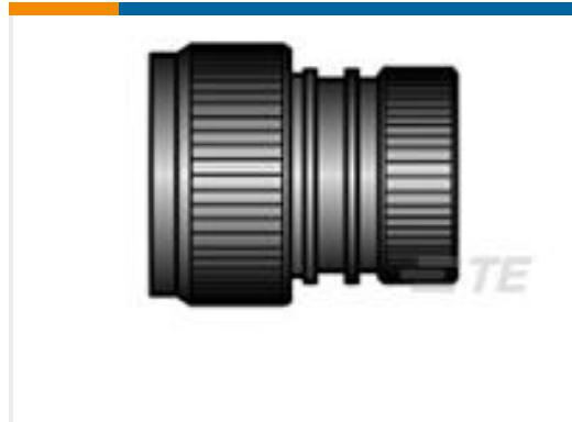
TE 产品编号527781-000 HEX40-AC-00-15-A5-1