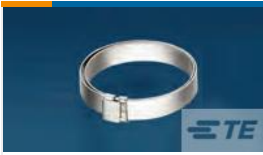
TE 产品编号 CW2823-000 R85049/128-3