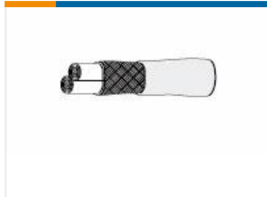
TE 产品编号272103-000 55A1123-20-9/96-9CS2275