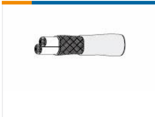
TE 产品编号272103-000 55A1123-20-9/96-9CS2275