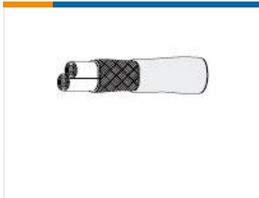
TE 产品编号272103-000 55A1123-20-9/96-9CS2275