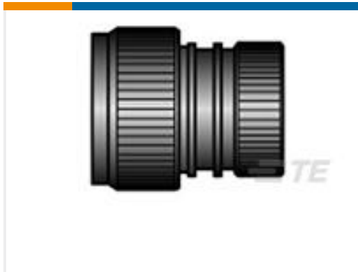
TE 产品编号527781-000 HEX40-AC-00-15-A5-1