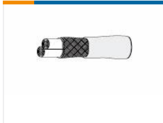
TE 产品编号272103-000 55A1123-20-9/96-9CS2275