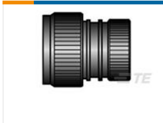
TE 产品编号527781-000 HEX40-AC-00-15-A5-1