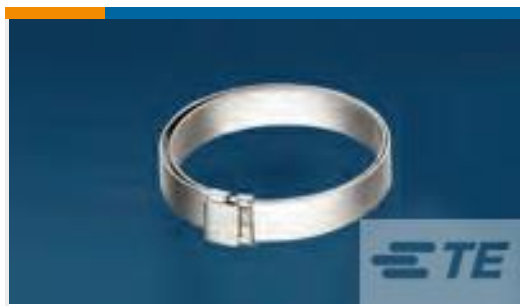
TE 产品编号 CW2823-000 R85049/128-3