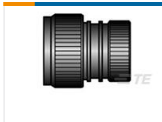
TE 产品编号527781-000 HEX40-AC-00-15-A5-1