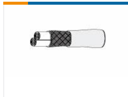
TE 产品编号272103-000 55A1123-20-9/96-9CS2275