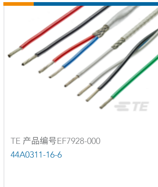
TE 产品编号EF7928-000 44A0311-16-6