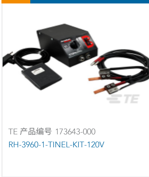
TE 产品编号 173643-000 RH-3960-1-TINEL-KIT-120V