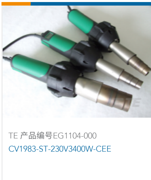
TE 产品编号EG1104-000 CV1983-ST-230V3400W-CEE