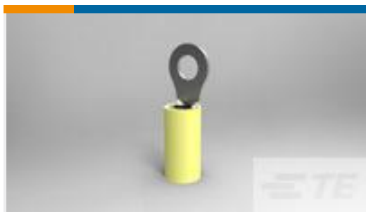
TE 产品编号35109 TERMINAL,PIDG R 12-10 10