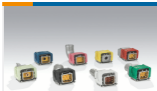
TE 产品编号ZPF00000000099713 DMC-MD 20 N