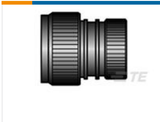
TE 产品编号 527781-000 HEX40-AC-00-15-A5-1