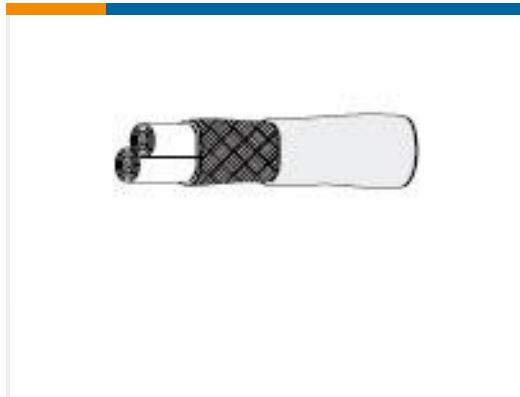
TE 产品编号 272103-000 55A1123-20-9/96-9CS2275