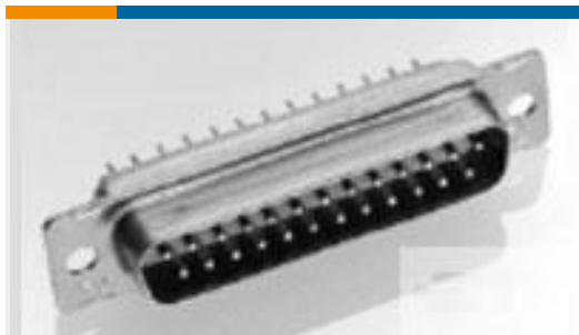
TE 产品编号 1757820-9 AMPLIMITE,ASY,RCPT,STD,109,ZN,4,CT