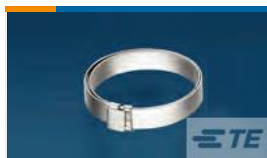
TE 产品编号 CW2823-000 R85049/128-3