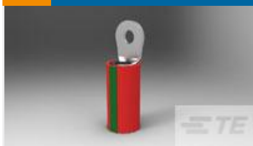
TE 产品编号 52273 TERMINAL,PIDG R IR 22 4