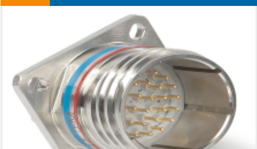
TE 产品编号 YDTS20F19-35SNV001 RECP ASSY