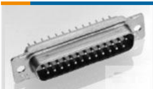
TE 产品编号 1-1757823-1 AMPLIMITE,ASY,PLUG,STD,90,ZN,5,CT