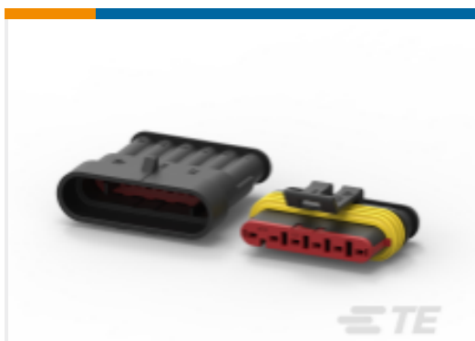
TE 产品编号 282104-1 AMP SUPERSEAL 1.5MM, 连接器壳体