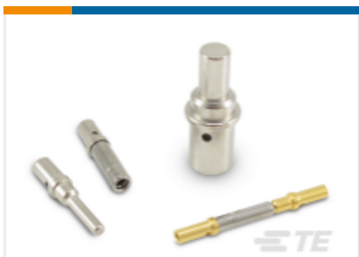
TE 产品编号 0460-202-16141 DEUTSCH Solid Contacts