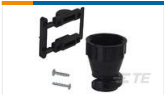
TE 产品编号 206070-8 CABLE CLAMP KIT #17