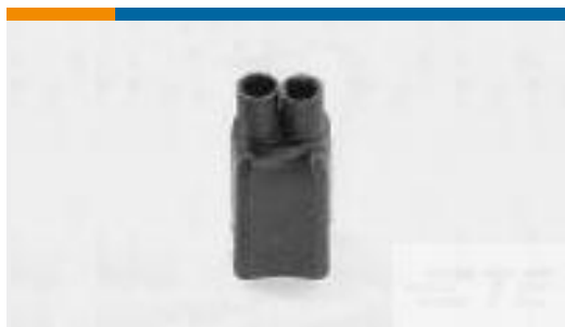
TE 产品编号037328-001 SSB-1202FR