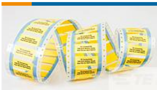
TE 产品编号5061850001 TMS-SCE-1/2-2.0-9