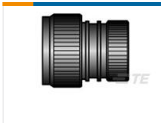
TE 产品编号527781-000 HEX40-AC-00-15-A5-1