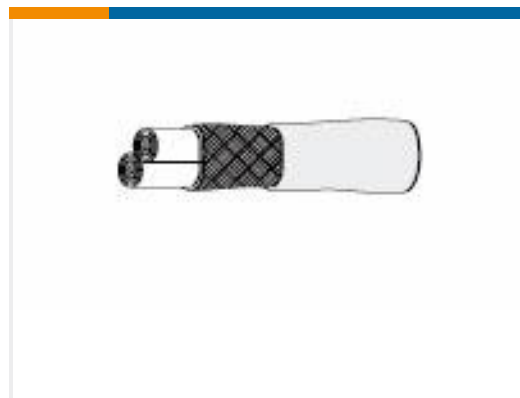
TE 产品编号272103-000 55A1123-20-9/96-9CS2275