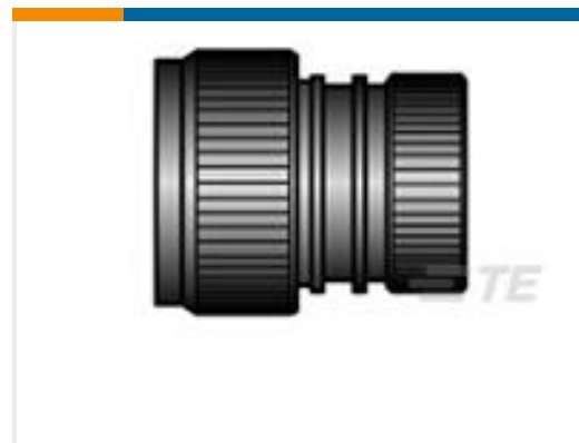
TE 产品编号527781-000 HEX40-AC-00-15-A5-1