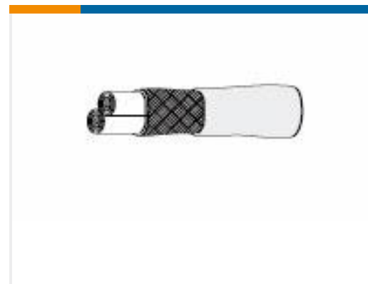
TE 产品编号272103-000 55A1123-20-9/96-9CS2275