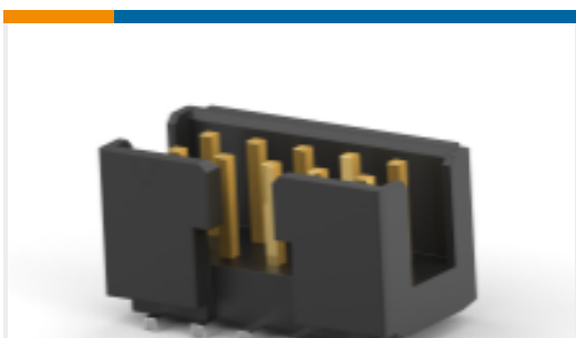
TE 产品编号1-2373376-0 10P,2MM,SHRD HDR,DRV,T,SMD,0.1 AU,TB