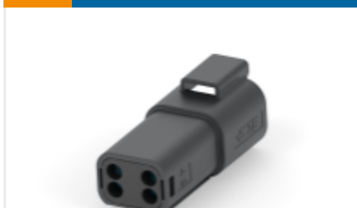
TE 产品编号1-2600030-0 4CCT BLACK RECEP W/LARGE SEAL