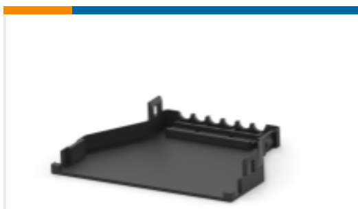
TE 产品编号1776695-1 Strain Relief, D5200, Dynamic AU,TB