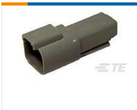
TE 产品编号DT04-2P REC, 2P, GRY, N