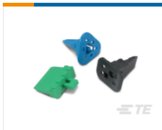
TE 产品编号W2S Wedgelocks: DEUTSCH DT