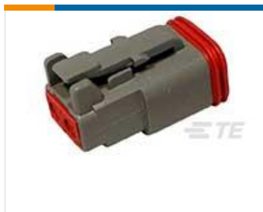
TE 产品编号DT06-2S PLG, 2P, GRY, N