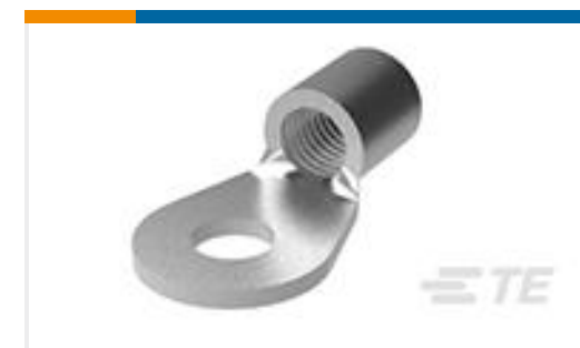
TE 产品编号324061 TERMINAL,SOLIS R 8 8