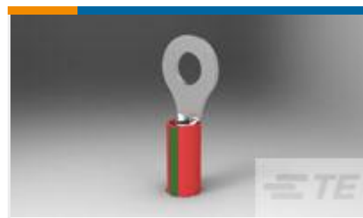
TE 产品编号1-320551-2 TERMINAL,PIDG R IR 22 8