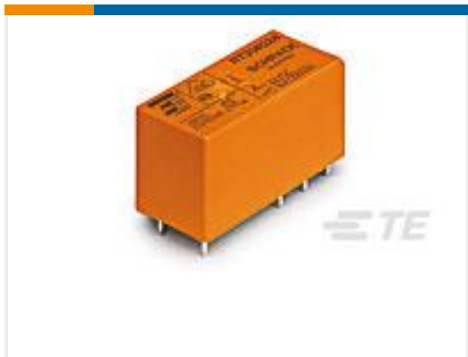
TE 产品编号7-1393243-9 RT424730