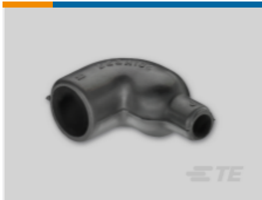
TE 产品编号903960-000 球形热缩护套：有嘴，直角