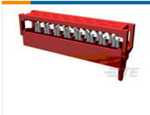
TE 产品编号7-215083-8 MICRO-MATCH MOW.08P