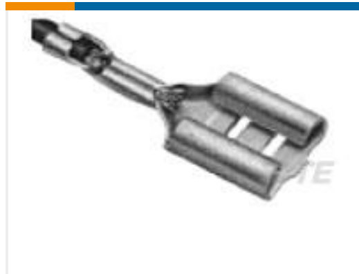
TE 产品编号344009-1 .250" SPEC.F.RECP.(PLATED)