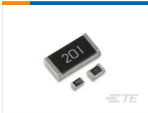
TE 产品编号1-2176327-5 CRGP 0805 150R 1%