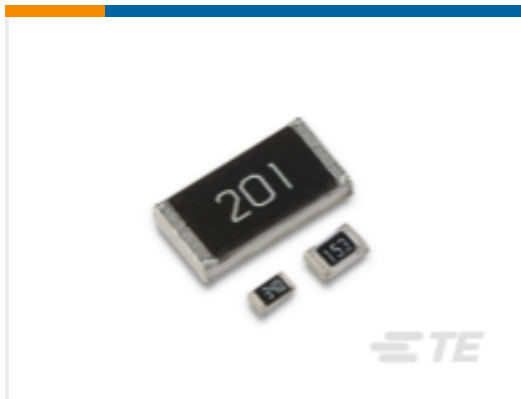
TE 产品编号4-2176327-9 CRGP 0805 100K 1%