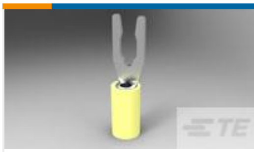
TE 产品编号52430-3 TERMINAL,PIDG SPR SPD 12-10 6