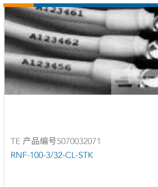
TE 产品编号5070032071 RNF-100-3/32-CL-STK