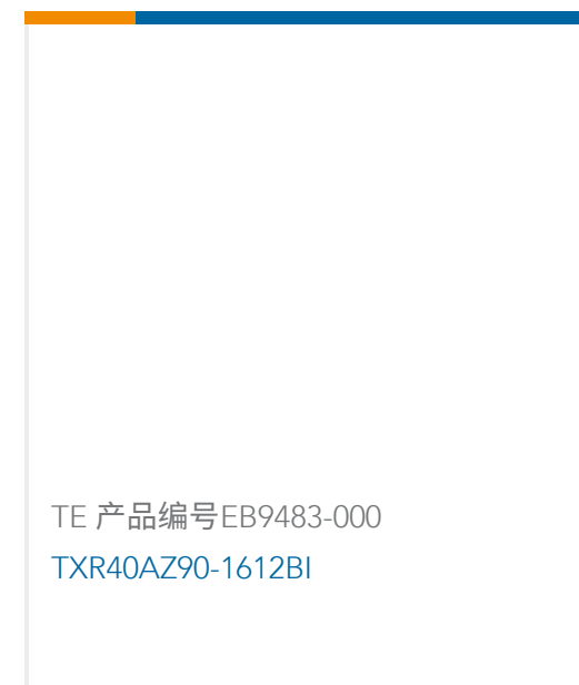
TE 产品编号EB9483-000 TXR40AZ90-1612BI