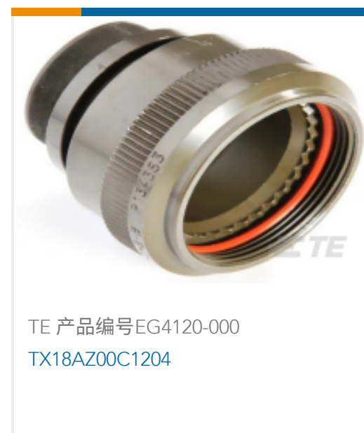
TE 产品编号EG4120-000 TX18AZ00C1204