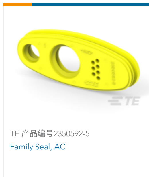
TE 产品编号2350592-5 Family Seal, AC