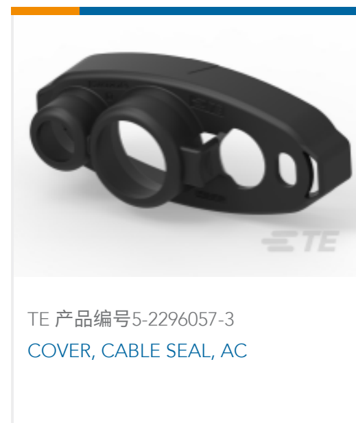
TE 产品编号5-2296057-3 COVER, CABLE SEAL, AC