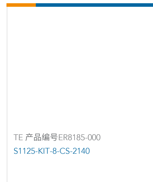
TE 产品编号ER8185-000 S1125-KIT-8-CS-2140