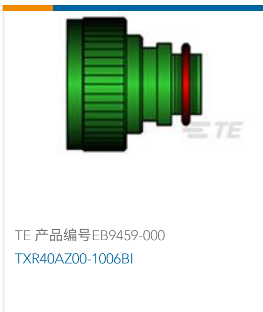
TE 产品编号EB9459-000 TXR40AZ00-1006BI