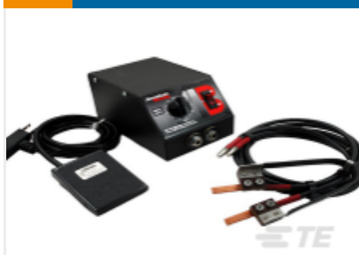
TE 产品编号 173643-000 RH-3960-1-TINEL-KIT-120V