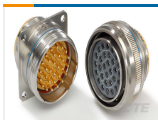
TE 产品编号ZPF000000000008758 983-6SE 10-06 PN