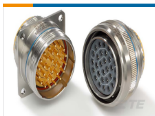
TE 产品编号ZPF000000000009000 983-6SE 22-55 PN