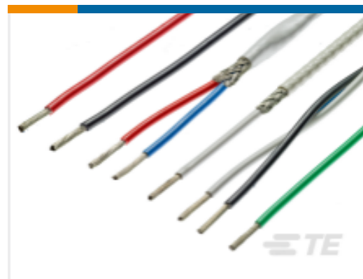
TE 产品编号4495283001 99M0121-20-6/9