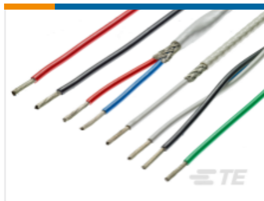
TE 产品编号6049673001 99M0121-24-0/2