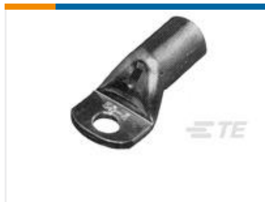
TE 产品编号710028-6 XCT 70-14