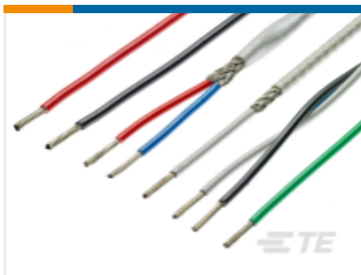
TE 产品编号8958873001 99M0121-22-0/2