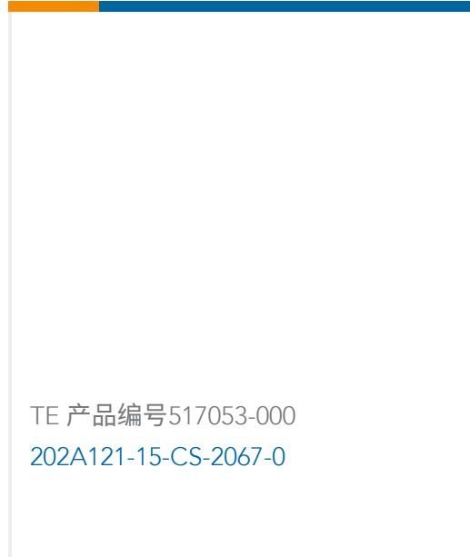
TE 产品编号517053-000 202A121-15-CS-2067-0