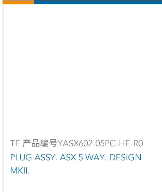
TE 产品编号YASX602-05PC-HE-R0 PLUG ASSY. ASX 5 WAY. DESIGN MKII.