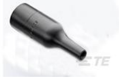
TE 产品编号CV7364-000 202K174-25L-0