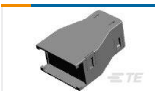
TE 产品编号1986185-1 Strain Relief,6 Posn,D5200 Dynamic. 2