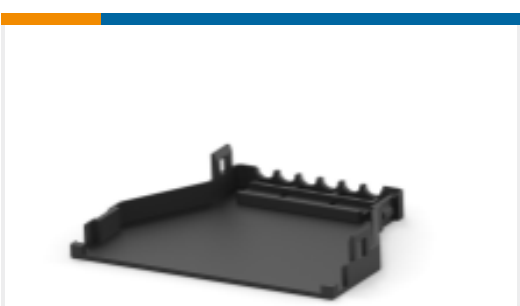
TE 产品编号1776695-1 Strain Relief, D5200, Dynamic