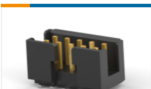
TE 产品编号1-2373376-0 10P,2MM,SHRD HDR,DRVVT,SMD,0.1 AU,TB