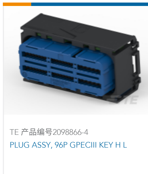
TE 产品编号2098866-4 PLUG ASSY, 96P GPECIII KEY H L