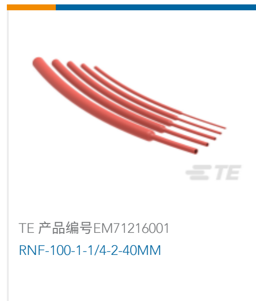
TE 产品编号EM71216001 RNF-100-1-1/4-2-40MM