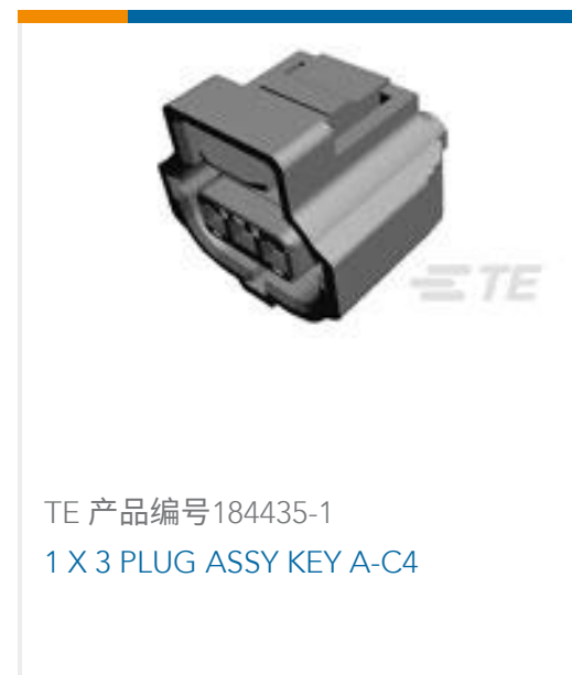
TE 产品编号184435-1 1 X 3 PLUG ASSY KEY A-C4