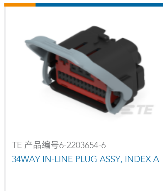
TE 产品编号6-2203654-6 34WAY IN-LINE PLUG ASSY, INDEX A