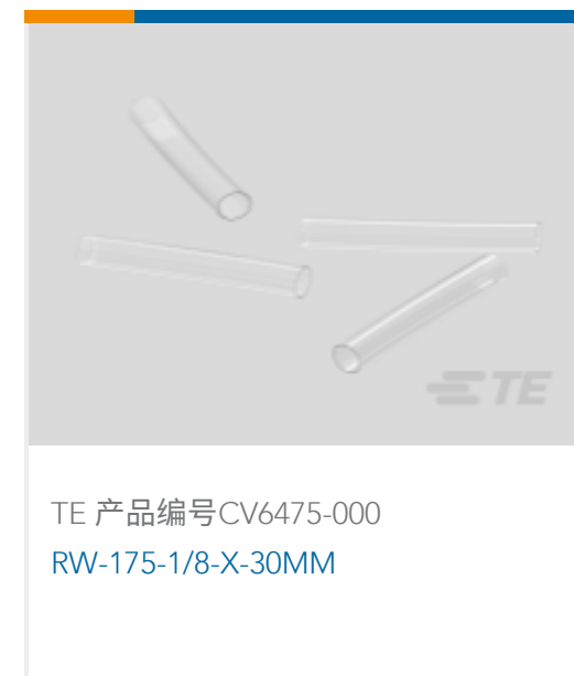
TE 产品编号CV6475-000 RW-175-1/8-X-30MM