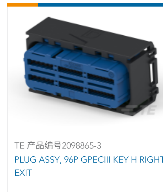
TE 产品编号2098865-3 PLUG ASSY, 96P GPECIII KEY H RIGHT EXIT