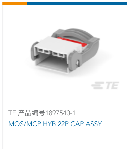
TE 产品编号1897540-1 MQS/MCP HYB 22P CAP ASSY