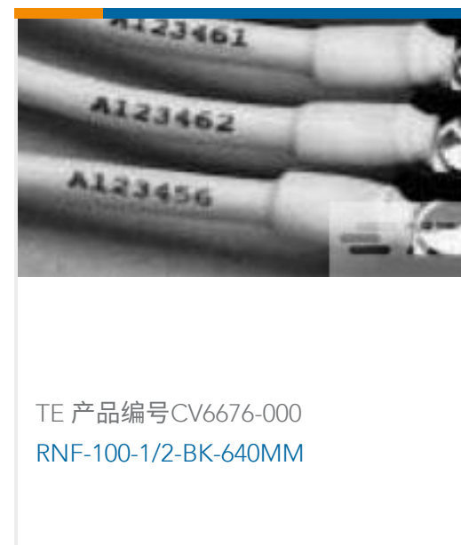
TE 产品编号CV6676-000 RNF-100-1/2-BK-640MM