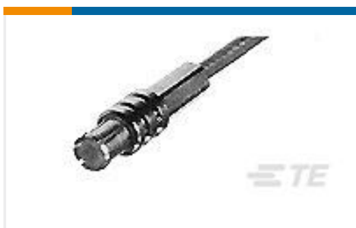
TE 产品编号1060875-2 MCX CABLE PLUG, CRIMP ATTACH