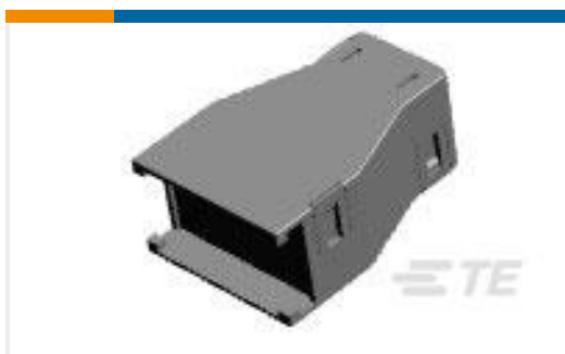
TE 产品编号1986185-1 Strain Relief,6 Posn,D5200 Dynamic, 2