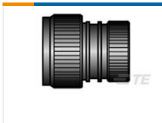
TE 产品编号527781-000 HEX40-AC-00-15-A5-1