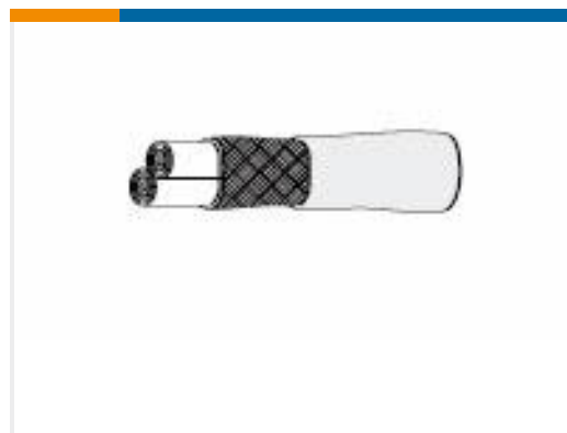
TE 产品编号272103-000 55A1123-20-9/96-9CS2275