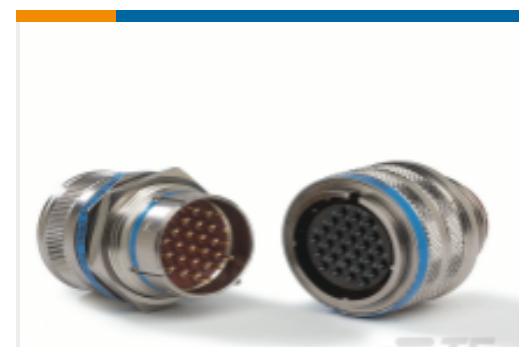
TE 产品编号ZPF00000000013431 DBAS 76G 19-0 SN 081